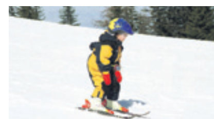
Sicher unterwegs: Sollte die Pflicht für alle werden?

Am Mittwoch, 21. Januar, um 18.30 Uhr, lädt der Verein Sicheres Liechtenstein (VSL) zu einer öffentlichen Veranstaltung in den Stöcklersaal des Gasthofs Löwen in Vaduz ein.