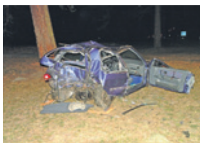
Beide Fahrzeuginsassen wurden durch die Kollision mit dem Baum verletzt.

In der Nacht auf Freitag ereignete sich auf der Landstrasse zwischen Triesenberg und Balzers ein Selbstunfall eines Fahrzeuglenkers. Aus noch ungeklärten Gründen kam der Personwagen kurz vor Mitternacht ins Schleudern und geriet über den Fahrbahnrand hinaus. Dort kollidierte er mit einem Baum, wodurch sich beide Fahrzeuginsassen verletzten. Am Personwagen entstand Total Schaden.