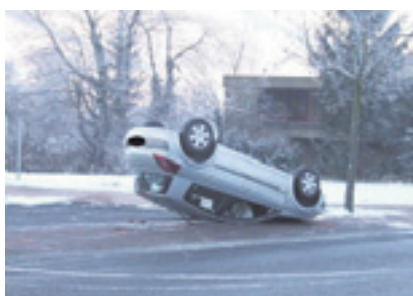
Durch einen Selbstunfall landete das Fahrzeug auf dem Dach, die Lenkerin blieb dabei unverletzt.

In den vergangenen Tagen ereigneten sich auf Liechtensteiner Strassen mehrere Verkehrsunfälle, bei denen sich Personen zum Teil schwer verletzt.