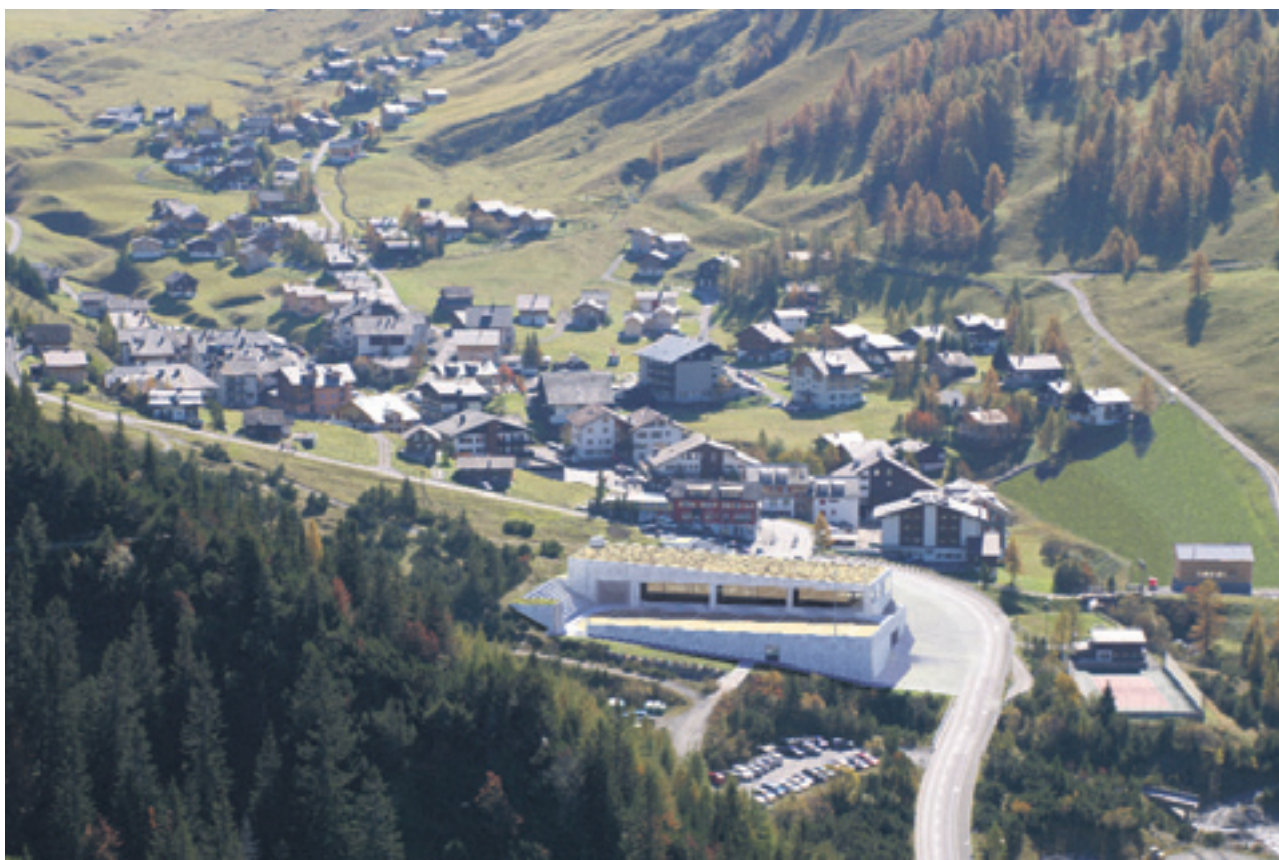
Die Lösung für das Verkehrsproblem: Das Projekt «Val Bun» der Gemeinde Triesenberg sieht eine Tiefgarage und Freizeitzentrum mit Eisplatz zwischen dem Alpenhotel und der Schlucher-Rüfe vor.

Geplant ist eine Tiefgarage für rund 12 Millionen Franken mit 350 Abstellplätzen ausschliesslich für die Bewohner und das Personal von Malbun. Eine Umfrage der Gemeinde hat gezeigt, dass es bereits heute Interessenten für 250 Tiefgaragenplätze gibt. Bereits 250 sind an Private verkauft. Die