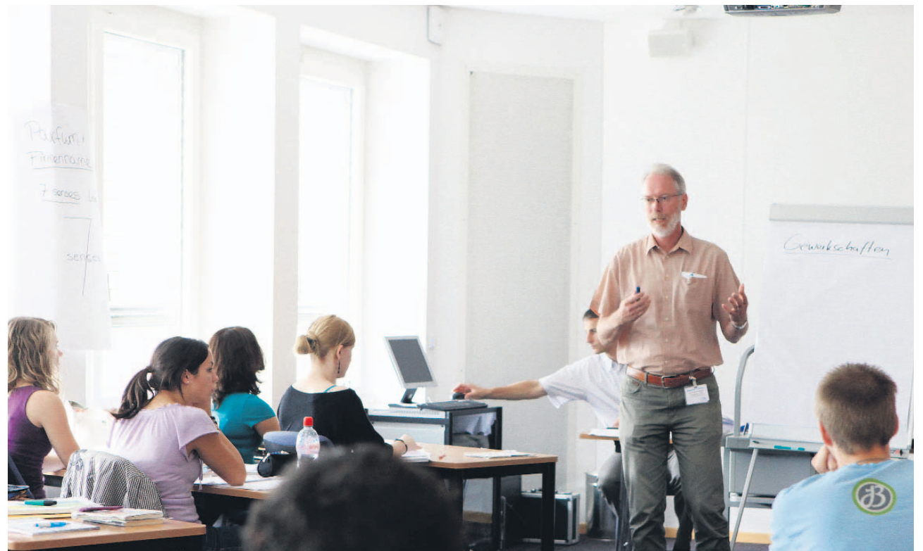
Praxisbezug: In der Wirtschaftswoche gewinnen die Gymnasiasten einen Einblick in die Betriebswirtschaftslehre.

Die Schülergruppe, welche die Wirtschaftswoche in der Ivoclar in Schaan absolviert, wurde in drei verschiedene Gruppen aufgeteilt, von der jede ihre eigene virtuelle Unternehmung gegründet hat. In diesen Unterneh-